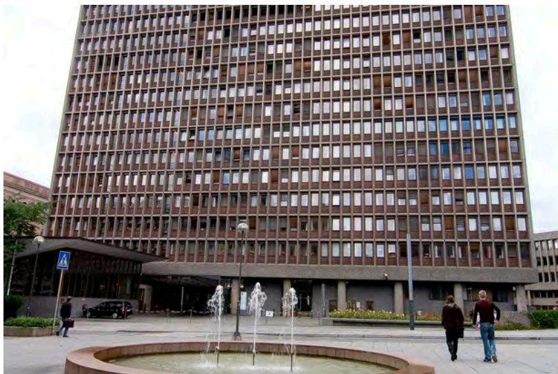
Regjeringskvartalet i Oslo